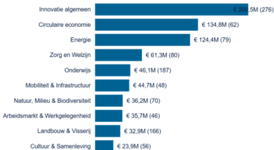
Figuur 3: Europese subsidie (en projecten) per topsector in Noord-Brabant (bron: ERAC. EU-subsidiemonitor 2021-2027 Zuid Nederland, Stimulus)